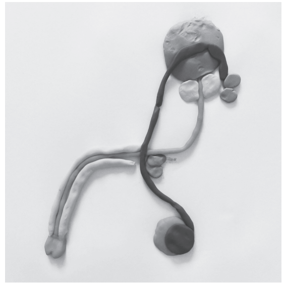
Abb. 2: Geschlechtsorgane von Schüler*innen der 6. Klasse geknetet. © Roberto Giacomini